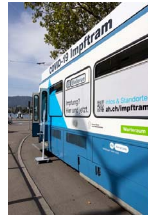
Das Impftram am Bellevue, bereit für den ersten Einsatz

«Die Impfung schützt das Gesundheitswesen vor der Überlastung»